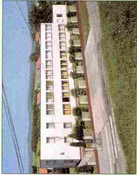
Základná škola, materská škola, Obecný úrad