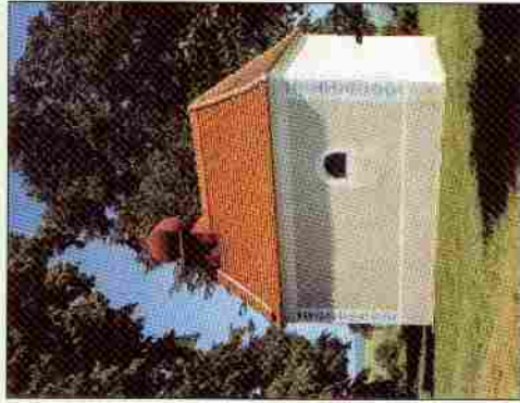
kaplnka sv. Anny

Naši vinohradníci postavili kaplnku sv. Urbana - patróna vinohradníkov, kde každoročne býva krátka pobožnosť, opekačka a dobré víno. Každé dva roky "koštujú víno" zo širokého okolia a v kultúrom dome zakončia